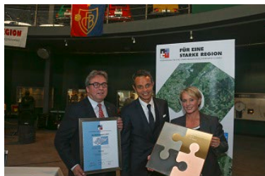
2014 FC Basel