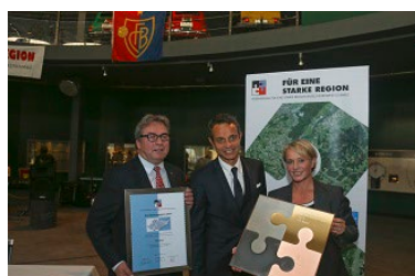
2014 FC Basel