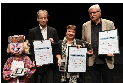
2018 Die Basler Fasnacht