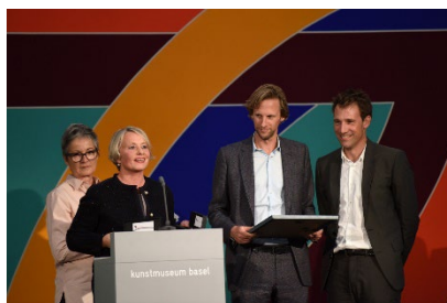
2017 Christ & Gantenbein