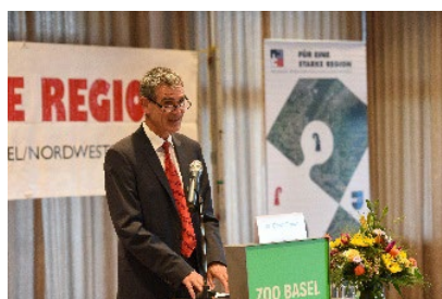
2016 Zoo Basel