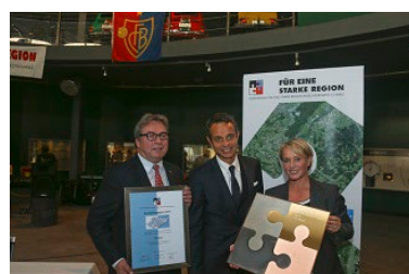
2014 FC Basel