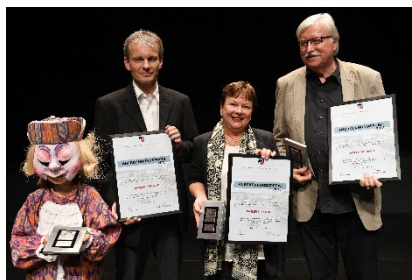
2018 Die Basler Fasnacht