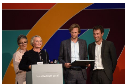
2017 Christ & Gantenbein